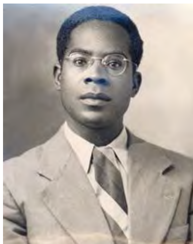
Aimé Césaire, date inconnue

Aimé Césaire aurait eu 100 ans le 26 juin 2013. A l'occasion de son centenaire, la Bibliothèque nationale de France a voulu faire redécouvrir l'œuvre littéraire et l'action politique de cet homme déterminant pour le XX ème siècle.