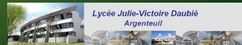
Lycée Julie-Victoire Daubié Argenteuil

La forte présence de l'enseignement général indispensable à la poursuite d'études