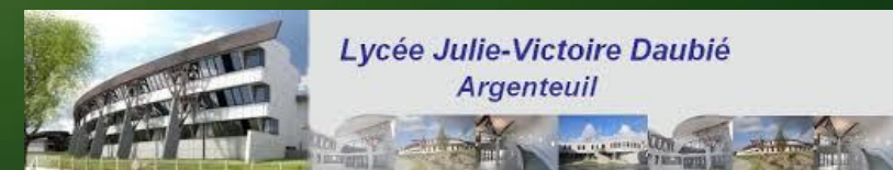
Lycée Julie-Victoire Daubié Argenteuil