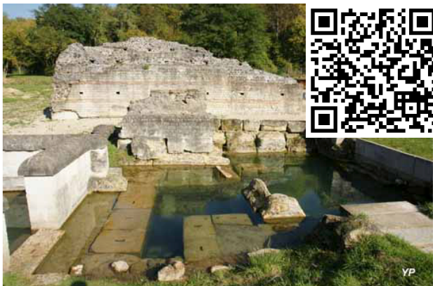
Site archéologique des Vaux de la Celle