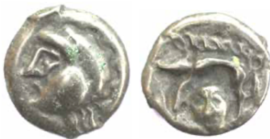
Potin des Parisii au type LT 9180, Le Mesnil-Aubry «Bois Bouchard IV» © SDAVO / C. Touquet.

Vous découvrirez comment déceler dans les champs des traces d'anciens bâtiments disparus depuis des milliers d'années.