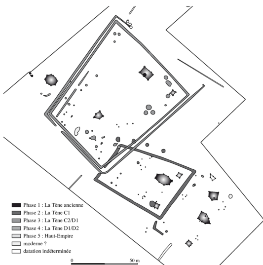
Plan phase du site du Mesnil-Aubry « Le Bois Bouchard IV ».

Ce nouvel atelier vous propose de découvrir le passé grâce aux traces matérielles qui vous entourent... mais que vous ne voyez pas.